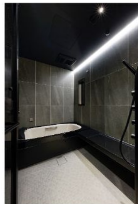
建物内はモノトーンを基調としたシンプルな雰囲気まとめられています。間接照明やトップライトの明かりが、それぞれの空間を際立たせます。