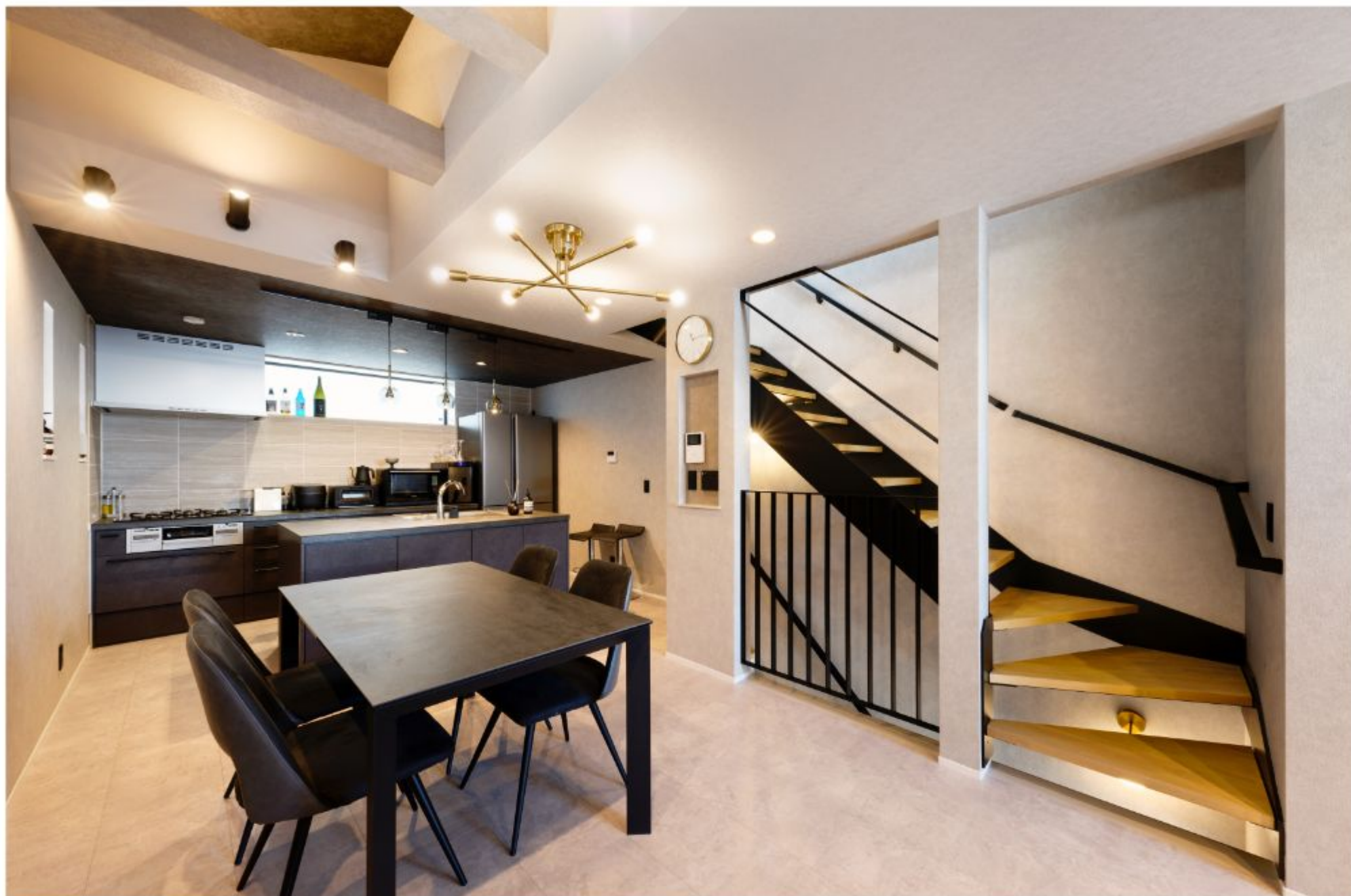
奥さまが一番こだわったのはリビングと一体化したアイランドキッチン。所々にセンスの良さが光ります。