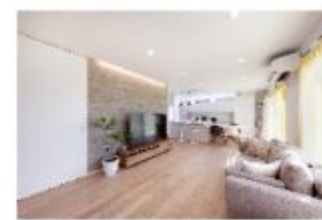
写真は弊社の施工例です