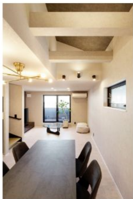
2階に配置したLDKは、光が集まる窓辺にリビングをレイアウトしました。