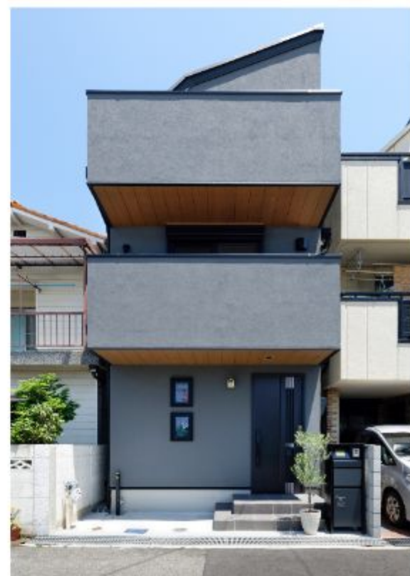
正面の外壁を漆喰塗りにしたのがご夫婦のこだわり。SE構法を採用したことで、耐震も最高等級の耐震等級3を実現しました。

A10. 主人が大工ということもあって自分たちの住居については細かなこだわりがたくさんありましたが、あんじゅホームは私たちのこだわりをほとんど叶えてくれたように思います。ぜひ皆さんも自分たちのこだわりや希望を遠慮なくあんじゅホームにぶつけてみることをおすすめします。人生は一度きり、私たちのように心から満足できる家を建築されることを心よりお祈りしています。