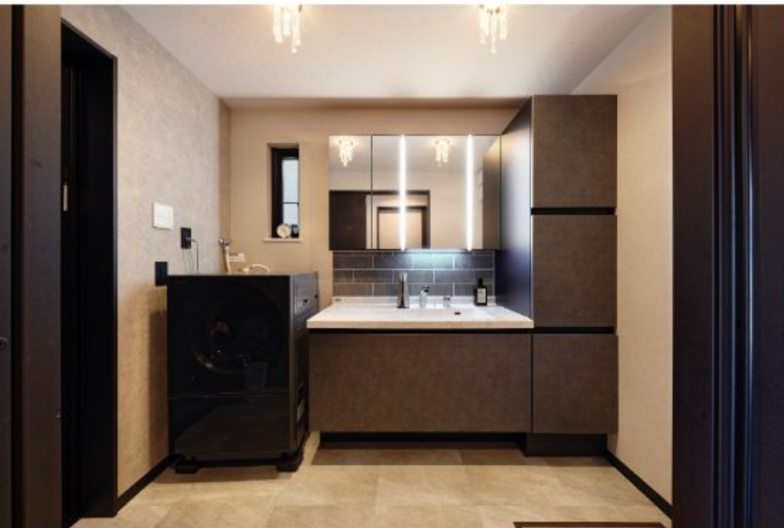
水廻りスペースはダーク系でまとめられており、明るい照明が映える造りになっています。