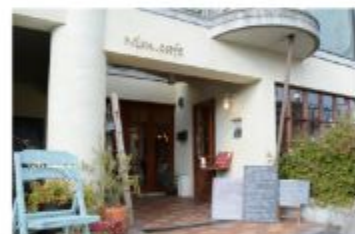
カフェ Nim.cafe (ニムカフェ)

〒657-0825 兵庫県神戸市灘区中原通6丁目1-15 078-806-3707 定休日 火曜日