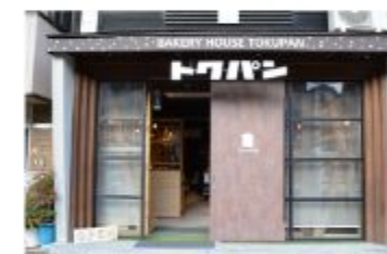
パン BAKERY HOUSE TOKUPAN

〒657-0846 神戸市灘区岩屋北町2丁目4-6 070-7489-3313 定休日 日曜日・不定休