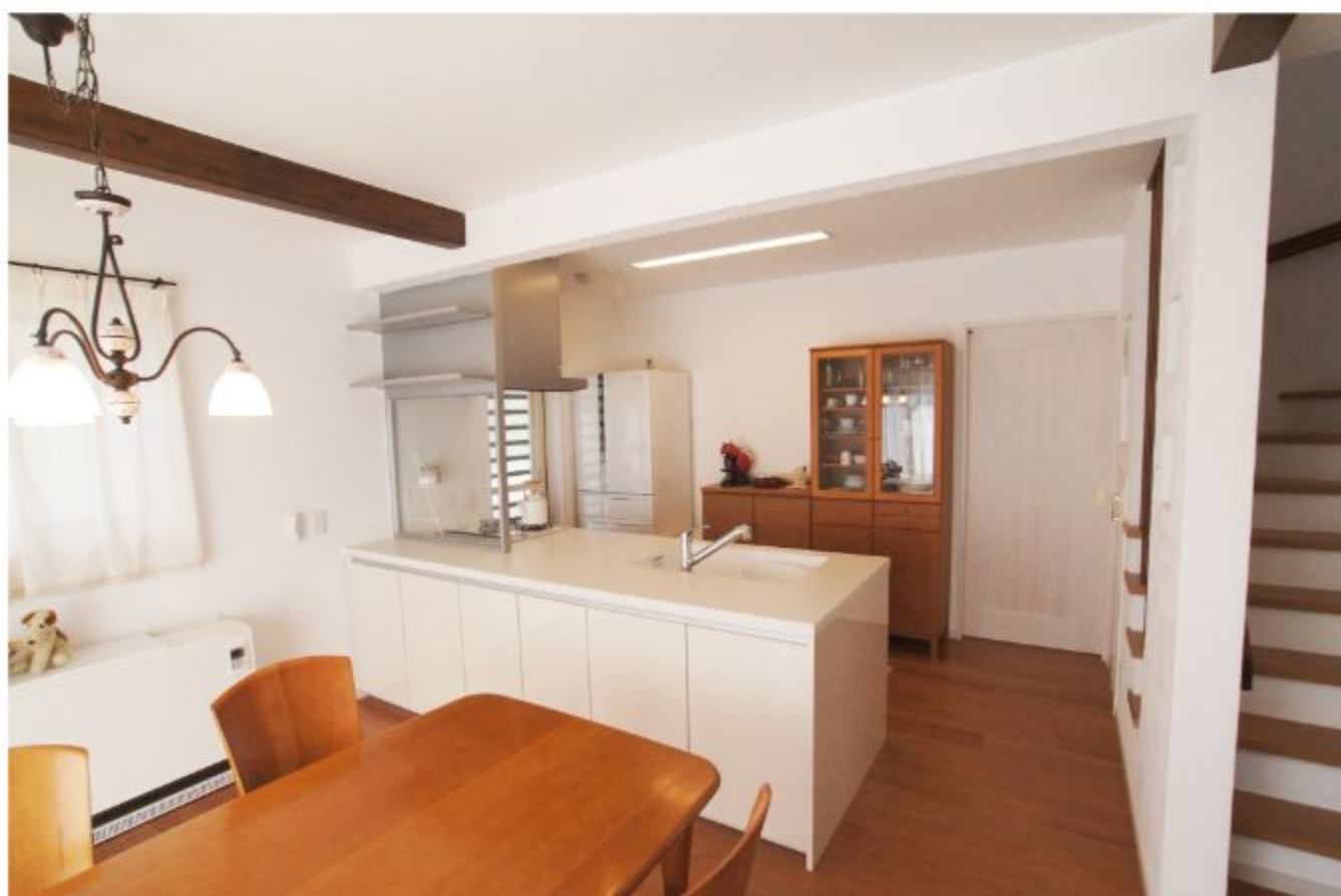
奥さまこだわりのカウンターキッチン。全体を見渡せるところがお気に入りです。

A3. もともと私たちの子どもには化学物質系のアレルギーがあり、以前から気管支炎や肺炎を発症することが多かったため、新居にはできるだけ化学物質が含まれていない建材や材料を使いたいと考えていました。あんじゅホームはそういう私たちの事情や希望をしっかりと組み取ってくださいました。さらに、そのうえで内容的にも価格的にも満足できる提案をしてくださりましたので、ほぼ即決状態で施工をお任せすることになりました。