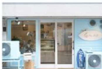
ケーキ 小さな菓子専門店 プアリリィ

〒657-0035 神戸市灘区友田町4丁目1-23 078-806-8242 定休日 不定休