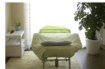
サロン メイクアップSiesta (シエスタ)