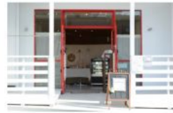
パウンドケーキ Cutiful (キュティフル)

〒657-0059 神戸市灘区森原南町5-5-14 078-891-8810 定休日 不定休