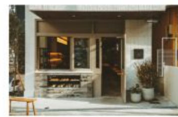
カフェ CHARMANT Cafe & COFFEE ROASTERY