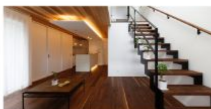
写真は弊社の施工例です