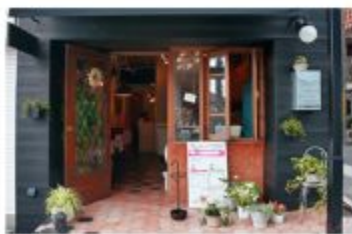
ガレット・クレープ LE MARRON

〒657-0064 神戸市灘区山田町2丁目1-12 078-855-4317 定休日 日曜日