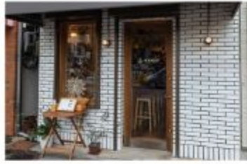
ワイン IN VIAGGIO

〒657-0836 神戸市灘区城内通5丁目2-4 078-223-3689 定休日 不定休