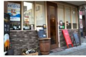
バル カフェ&シーフードバル ベセル

〒657-0036 神戸市灘区桜口町5丁目1-1 ウェルブ六甲道5番街1番館108 078-855-5460 定休日 火曜日