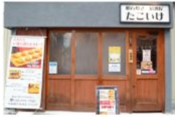
明石焼居酒屋 明石焼居酒屋「たこいけ」

〒657-0838 兵庫県神戸市灘区王子町1丁目3-23 078-585-7350 定休日 月曜日・木曜日