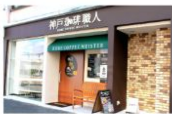
カフェ 「神戸珈琲職人」のカフェ 神戸本店

〒657-0841 神戸市灘区灘南通6丁目2-20 078-871-1189 定休日 土曜日・日曜日・祝日