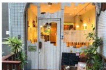
カフェ Teacafe Colour

〒657-0838 神戸市灘区王子町1丁目2-21 サンビルダー王子公園101 078-882-6010 定休日 木曜日