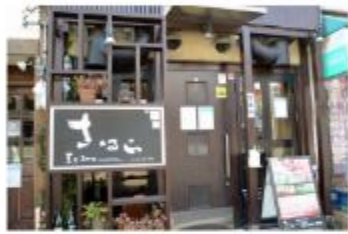
焼肉 黒毛和牛焼肉 さはら

〒657-0821 神戸市灘区赤坂通5丁目3-11 078-802-8929 定休日 月曜日 (月曜日が祝日の場合は火曜日休み)