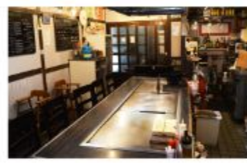
韓国料理 韓国料理店 jinan

〒657-0831 神戸市灘区水通筋3丁目1番地 078-891-7077 定休日 月曜日