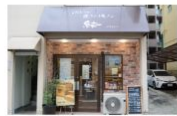
パン 食パン専門店 結-YUI-

〒657-0838 神戸市灘区王子町1丁目1-15 078-862-3900 定休日 水曜日