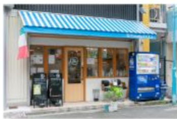
イタリアン Pizzeria RICCA

〒657-0838 神戸市灘区王子町1丁目3-23 レインボープラザ102 078-262-1292 定休日 水曜日・火曜日ディナータイムのみ