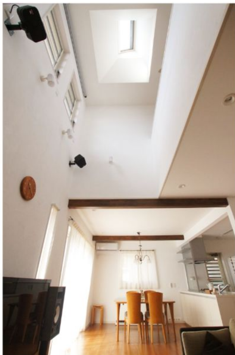
吹き抜けのリビングには天窗を設置。天窗から優しい光をLDKへ届けます。