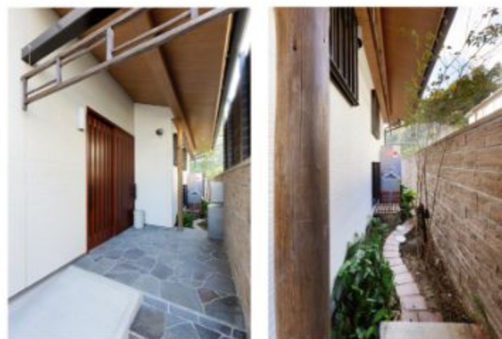
玄関のドアを挟んで内側の鉄平石が連続しているおしゃれな玄関ポーチ。奥には友人の芸術家が制作した鬼瓦を生かしたオブジェも飾られています。

A9. あんじゅホームさんにリフォームをお願いしてよかったと、母を始め家族全員が本当に感謝しています。私たちの無茶振りにしっかりと対応していただき、今となっては「あんじゅホームさん以外では無理だったな」と思えることがたくさんあります。今回のリフォームが素晴らしい仕上がりでしたので、知人の家や職場のリフォームを引き続きお願いすることになり、あんじゅホームさんとはこれからも長い付き合いになりそうだと感じています。