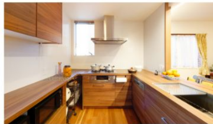
使いやすさを重視した広くて明るいキッチン。木目調は奥さまのこだわりです。