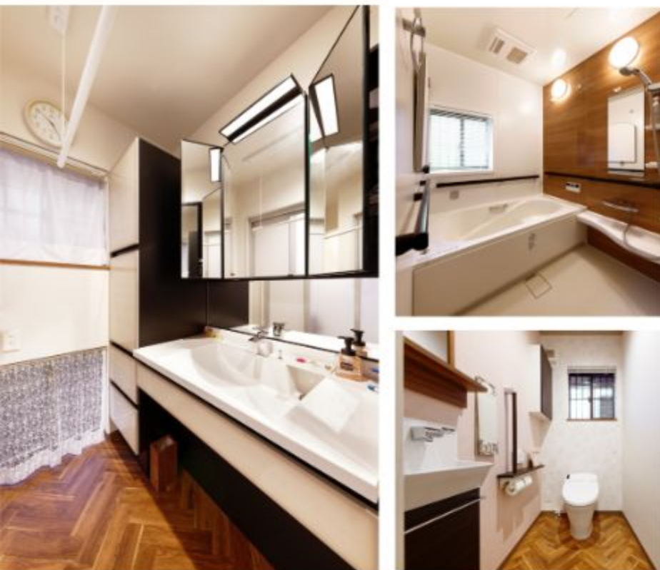
お風呂とトイレは車椅子のままでも利用できるようにバリアフリーで空間を広く設計しました。