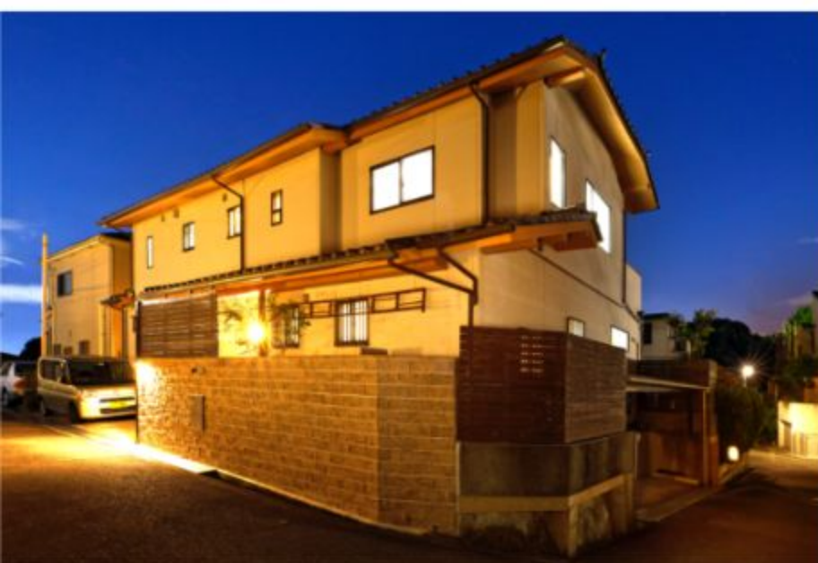
建物は閑静な住宅地に行っており、ご家族の皆さまが大満足のリフォームとなったそうです。

A10. 実際にリフォームをすることになって、私たち家族は「何を残して何を新しくするのか」について、時間をかけてしっかりと話し合えたことがよかったと思います。将来のライフスタイルや家族それぞれの希望も含めて、まずは一度気軽に相談してみるのいいのではないのでしょうか？どのような質問でも真摯に対応くださりそのうえで想像を上回る提案をしてくださるので、あんじゅホームさんを私たちは自信を持っておすすめします。