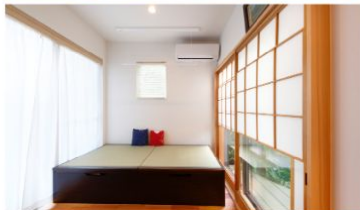
建物内は和モダンを重視として上品にすっきりとまとめられています。 2階天井の梁や、以前の座敷で使われていた雪見障子も生かされています。