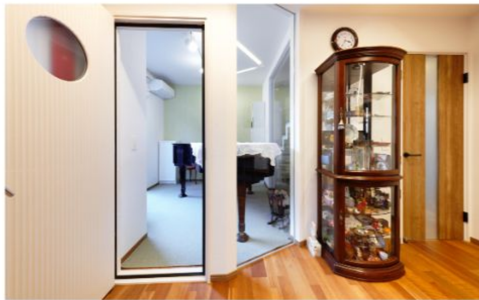
音楽室はガラス張りのため、リビングからでも演奏中の様子を楽しむことができます。

A4 長らくこの家に住んでいた母からの希望は「とにかく居住スペースを狭くしないこと」だったのですが、生活の都合でどうしても駐車スペースをもう一台分確保する必要があり、同取りの設計ではあんじゅホームさんには多大なご苦勞をおかけしたのではないかと思います。建物内の大半をバリアフリー化し、そのうえで将来的には車椅子でも生活できるようにと寝室から浴室やトイレまでの動線を広くて移動しやすいように工夫していただきました。