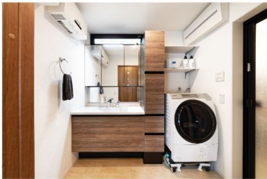
ドラム式の洗濯機がスッキリ配置できる広い洗面スペース。