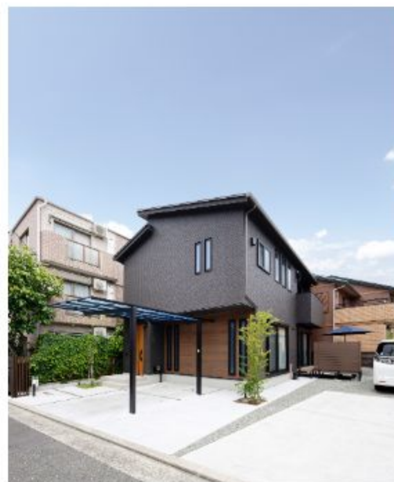
1階部分に施した木調のあしらいが特徴的。青空と緑が似合う差掛け屋根の外観。