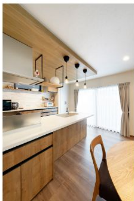
折り下げ天井がアクセントになっているキッチン。天井とキッチンの木目で統一感を演出。