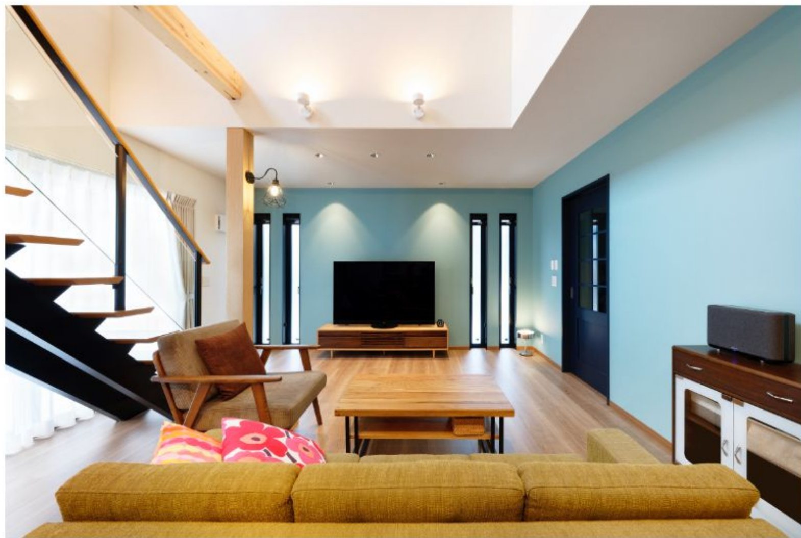
南側の大開口から自然光が優しく照らすリビング。広い吹き抜けで開放感もあり、くつろげる空間に。