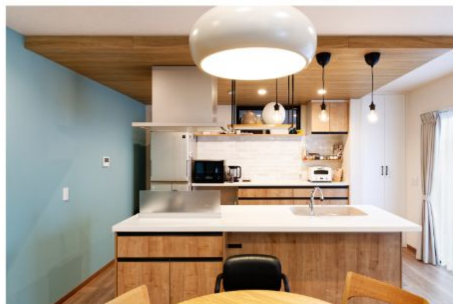
家事効率の良いアイランドキッチン。淡いブルーのアクセントクロスが印象的で木目を基調としたデザインと調和する。

A5. 夫婦揃って完成した自宅を初めて見たときは「いい家だなあ〜」と素直に思いました。事前に設計図や現場写真などを拝見していたこともあって、出来上がった家を自分なりに想像していましたが、その想像をはるかに超える仕上がりになったと思います。職人さんやあんじゅホームのスタッフさんには本当に感謝しています。