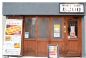
明石焼居酒屋 明石焼居酒屋「たこいけ」

〒657-0838 神戸市灘区王子町1丁目3-23 078-585-7350 定休日 月曜日・木曜日