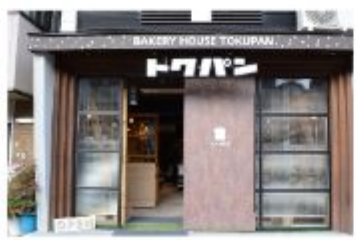
パン BAKERY HOUSE TOKUPAN

〒657-0846 神戸市灘区岩屋北町2丁目4-6 070-7489-3313 定休日 日曜日・不定休