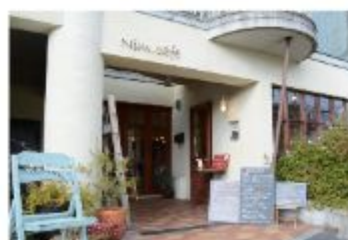
カフェ Nim.cafe (ニムカフェ)

〒657-0826 神戸市灘区中原通6丁目1-15 078-806-3707 定休日 火曜日