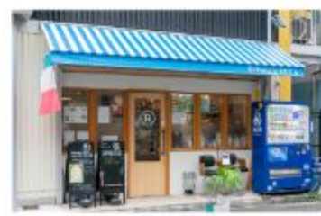
イタリアン Pizzeria RICCA

〒657-0838 神戸市灘区王子町1丁目3-23 レインボープラザ102 078-262-1292 定休日 水曜日・火曜日ディナータイムのみ