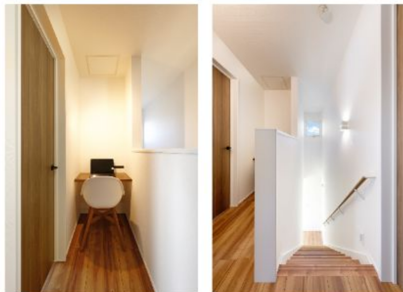
階段脇のデッドスペースも作業スペースとして有効活用しています

A8. 私が気に入っている場所はアイランドキッチンですね。この家を建てる少し前に弟夫婦が実家の建て替えをしてキッチンをアイランドにしたのですが、家事の動線がシンプルになって使いやすかったと聞きました。その時、「私も家を建てる時は絶対にキッチンはアイランドにしよう」と強く思ったことを覚えています。また、夫は玄関がお気に入りの場所だと言っています。この家は基本的に私の意見が尊重されているのですが、玄関だけは主人の意見を丸々採用して作っていただきました。今でも家に帰ってくるたびに「いい玄関だなあ」と思っているそうですよ。