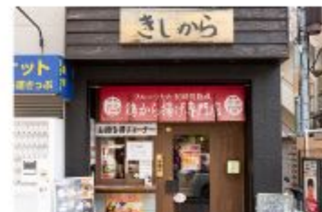
からあげ きしから 灘・岩屋店

〒657-0846 神戸市灘区岩屋北町4-3-10 1F 078-806-3550 定休日 不定休