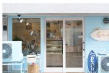
ケーキ 小さなお菓子専門店 フアリリィ

〒657-0035 神戸市灘区友田町4丁目1-23 078-806-8242 定休日 不定休