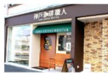
カフェ 「神戸蹴球戦人」のカフェ 神戸本店

〒657-0841 神戸市灘区灘南通6丁目2-20 078-871-1189 定休日 土曜日・日曜日・祝日