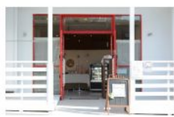
パウンドケーキ Cutiful (キューティフル)

〒657-0059 神戸市灘区篠原南町5-5-14 078-891-8810 定休日 不定休