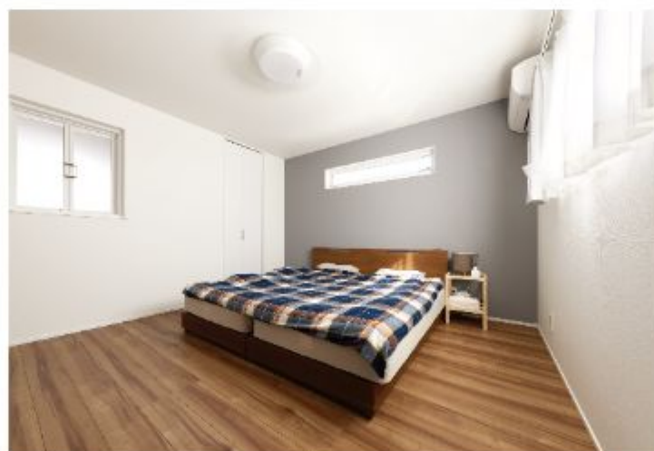
寝室などのプライベートスペースは飽きが来ないようにあえてシンプルにしました