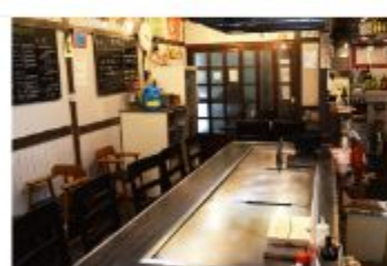
韓国料理 韓国料理 jinan

〒657-0831 神戸市灘区水道筋3丁目1番地 078-891-7077 定休日 月曜日