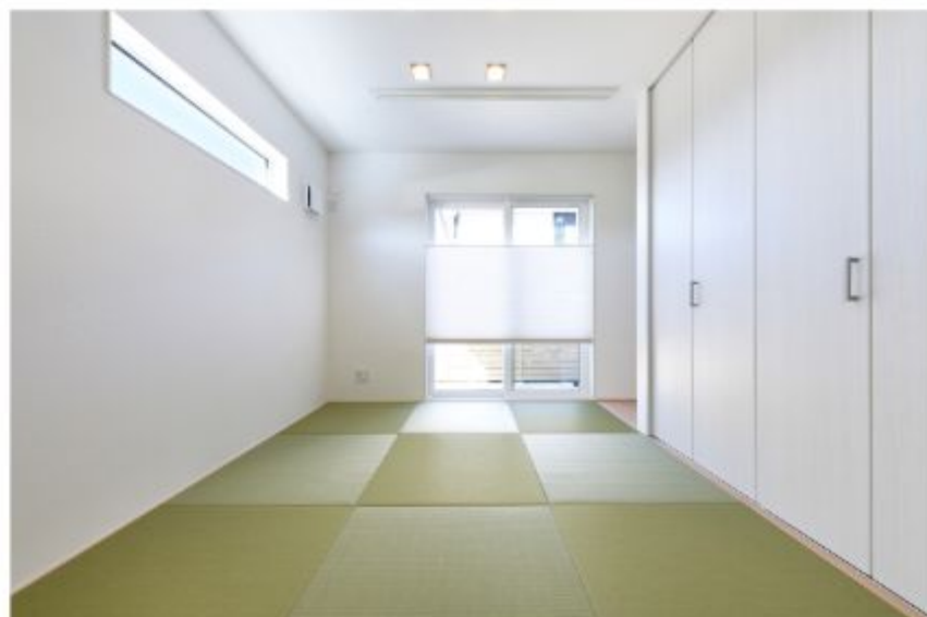
ホワイトでまとめられた空間に和豊の緑がよく映えます

A5. 最初に完成した自宅を見たときの正直な感想は「でっかっ！」でした（笑）。もちろん私たちも設計図などで大まかな完成イメージを把握していたつもりでしたが、実際に実物を目の当たりにすると「このスペースにこんな大きな建物が建つなんて…」という驚きが強かったですね。