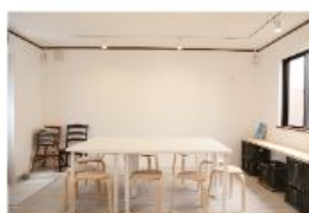
コミュニティスペース kiten