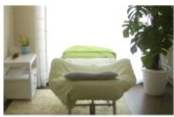
サロン メイクアップSiesta (シエスタ)