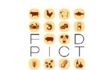
コンサルティンググループ フーズフーズ