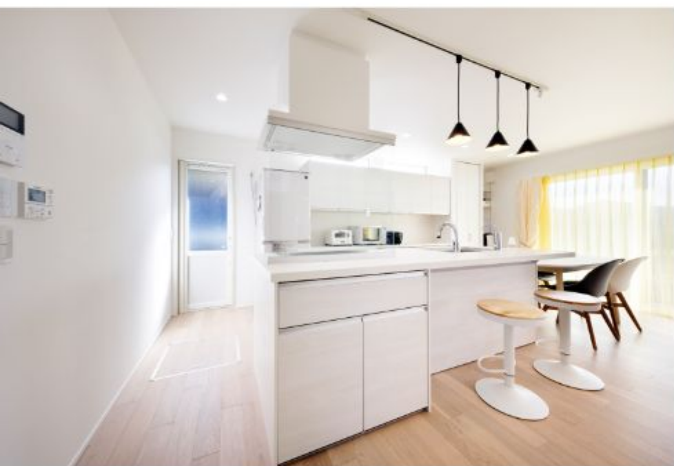
キッチンアイランド型にしたおかげで動きやすい動線になったそうです