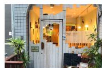
カフェ Teacafe Colour

〒657-0838 神戸市灘区王子町1丁目2-21 サンビルダー王子公園101 078-882-6010 定休日 木曜日