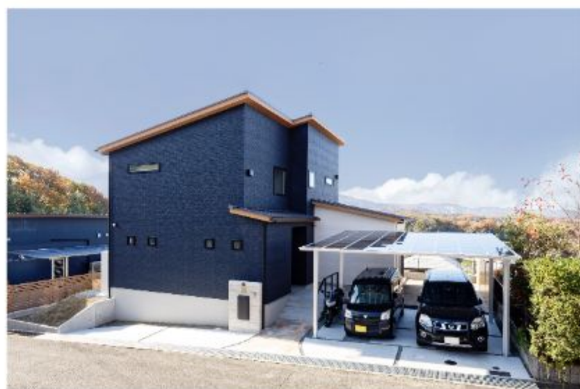
自然が豊かで静かな高台にご夫婦のこだわりが詰まった家が完成しました

A10. 家を建てるよと決めてから私たちもそれなりに勉強をしたつもりですが、実際の施工が始まってからは想像していなかったことや考えが及ばなかったことがたくさんあったことに気づかされました。やはり餅は餅屋ではないですが、経験豊富な方にアドバイスを求めるのが一番大切ではないかと思えます。幸いあんじゅホームには知識や経験が豊富なスタッフさんが揃っていますので、打ち合わせのときに自分たちの気持ちや要望をしっかりと伝えておけば、当初のイメージに近い家ができると思えます。ぜひ理想の家をあんじゅホームのスタッフさんと一緒に作っていただきたいですね。