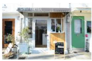
カフェ 朔コーヒー