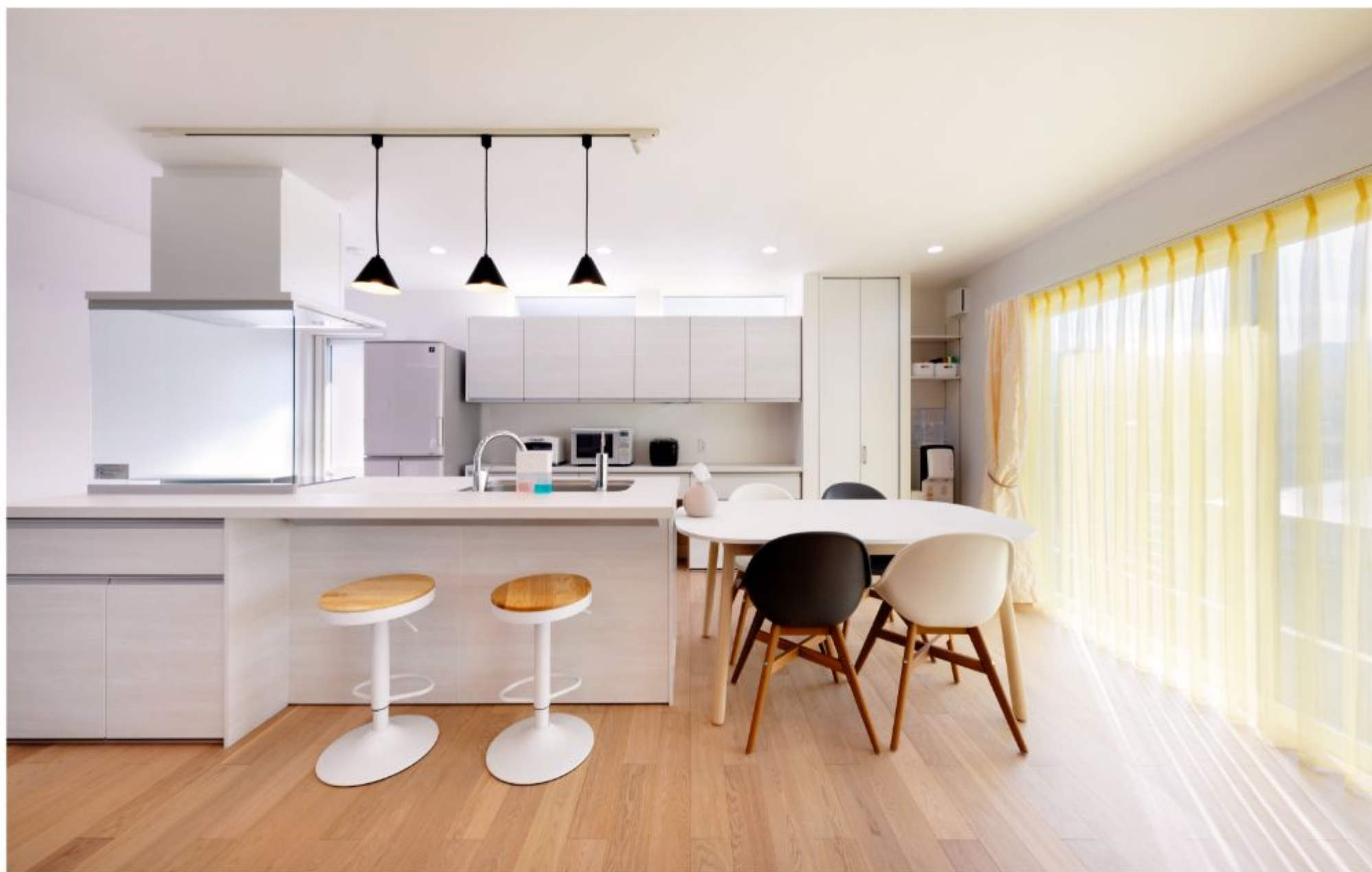
とにかく明るい家になるように、リビングには外光を十分に取り込める大きな窓を南側に設置しました