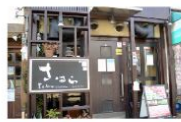
焼肉 黒毛和牛焼肉 さはら

〒657-0821 神戸市灘区赤坂通5丁目3-11 078-802-8929 定休日 月曜日 (月曜日が祝日の場合は火曜日が休み)