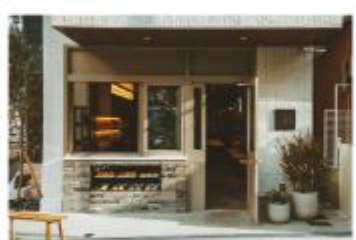
カフェ CHARMANT Cafe & COFFEE ROASTERY