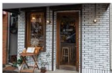
ワイン IN VIAGGIO (インヴィアジッジョ)

〒657-0836 神戸市灘区城内通5丁目2-4 078-223-3689 定休日 不定休