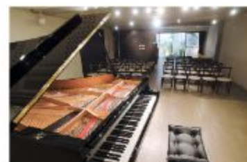
スタジオ 音楽ホール&ギャラリー「里夢」

〒657-0063 神戸市灘区宮和町1-4-2-B1 電話：078-821-2140 定休日 12月31日、1月1日、2日