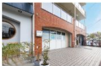
便利屋業 いつもの便利屋

〒658-0045 神戸市東灘区御影石町2-13-20-203 0800-888-4694 定休日 不定休