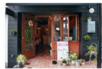
ガレット・クレープ LE MARRON (ルマロン)

〒657-0064 神戸市灘区山田町2丁目1-12 078-855-4317 定休日 日曜日