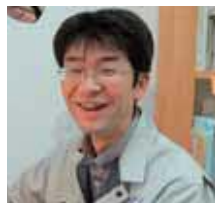
設計/草野 富博 一級建築士