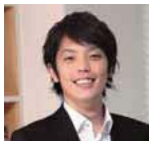
設計/深澤 侑也 二級建築士