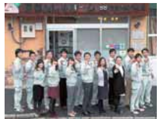
あんじゅホームスタッフ一同

私たちは、お客様と一生お付き合いしていくという覚悟をもって家づくりに励んでいます。その長いお付き合いでは、月並みで当たり前のことが、長い年月がたつと大きな差になります。それが、私が建築業界に61年間携わって出てきた結論です。